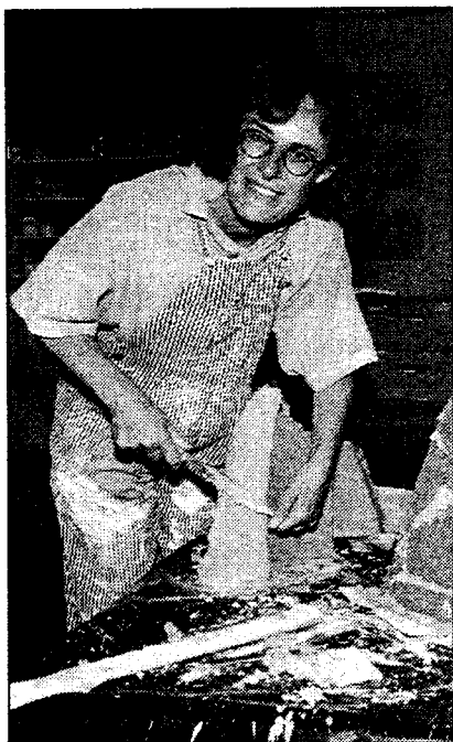
De keramiste aan het werk in haar atelier te Stolwijk.